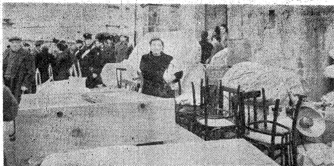
La evacuación, con mobiliario y toda clase de enseres, continúa en Pozzuoli. Ya son treinta mil vecinos los que se han ido.

ROMA. (Por teléfono, de nuestra corresponsal).—Las gaviotas no se atreven a posarse en el agua. La noticia que trajeron los pescadores de que el mar hierve a lo largo de la costa ha sido confirmada por las registraciones de la nave oceanográfica "Ulises": los técnicos a bordo han establecido que a un kilómetro de la costa, en la zona del epicentro de los nuevos movimientos sísmicos, que los sismógrafos registraron el domingo pasado, se han abierto nuevas "pumarolas" a una profundidad de cuarenta metros.