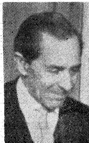
gráficas consideradas preferentes.

Se refirió a las posibilidades que nuestra legislación ofrece a las inversiones extranjeras, que son ilimitadas dentro del Plan de Desarrollo, y a los beneficios que se conceden en las zonas geo-