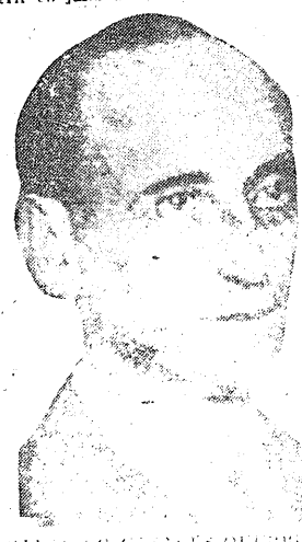
SANTIAGO CASARES QUIROGA