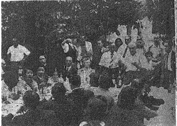
El 12 del corriente, el Centro Democrático Español de San Fernando y Tigre, celebró una fiesta de camaradería en el aniversario del Descubrimiento de América. Con los miembros de la entidad compartieron horas de grato solaz representantes de sociedades amigas. El grabado reproduce un instante de la animadísima reunión, en la que los correligionarios de San Fernando y Tigre hicieron un verdadero alarde de cordialidad y atenciones en obsequio de sus invitados.