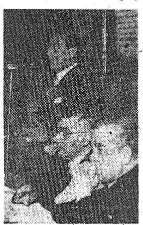
Dr. LUIS JIMENEZ DE ASUA