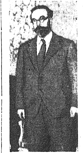
Don Fernando de los Rios, ilustre promotor y uno de los más ardientes defensores de la democracia española, que acaba de fallecer en Nueva York.

El franquismo está en capilla. Su agonia puede prolongarse, en detrimento mayor de la economía española; pero no tiene solución.