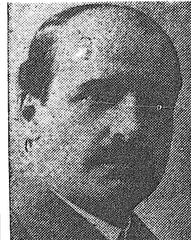
Ortega y Gasset, en aquel tiempo, ya un tanto lejano, en que afirmaba solemnemente que la democracia liberal es el medio propio de la cultura. Consecuente con sus doctrinas, volvió a España para embriagarse de democracia liberal y, naturalmente, de exquisita cultura