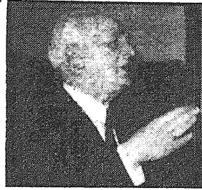
gia orientada siempre al porvenir; "único reino del ideal".

Ha traído semillas vivas, y en surcos profundos que el mismo trazó en tierras nunca labradas, dejó los gérmenes de prodigiosa vegetación. El solo ha creado una escuela de estudios históricos y ha realizado la hazaña de darnos lo más puro de su inteligencia, lo más entrañable de su alma, sin pedirnos nada. Como lema de su vida y de su labor, ha puesto estas palabras de Unamuno: "Robinsones llenos de fe, de esperanzas y de amor, dejemos el viejo suelo que nos sofoca el alma, y llevando en su esta el viejo mundo concentrado, su civilización hecha cultura, busquemos las islas vírgenes y desiertas todavía, preñadas de porvenir y castas con la castidad del silencio de la historia, las islas de la libertad, radicante en la santa ener-