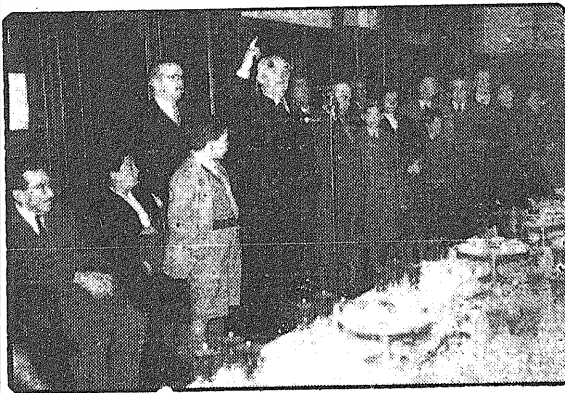
Un aspecto del acto conmemorativo del 25 de Mayo celebrado en el Centro Republicano Español