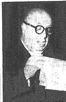
FRIETO en su intervención ante el Congreso opositor y tiránico, trascendental materia en la cual siguen las negociaciones y acomodos con el régimen español.

No sabemos el efecto que la nueva declaración platónica causará en el ánimo de Franco, quien hasta ahora ha podido sorprender gran multitud de los escollos que le ha opuesto la retórica democrática que en nada afecta a la vida económica de su régimen