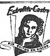
SUS FOTOS EN DICHO