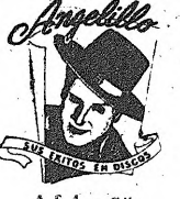
SUS FOTOS EN DICHO