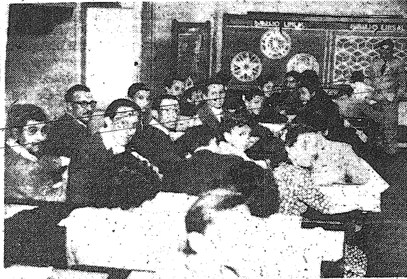
Una de las clases en funcionamiento