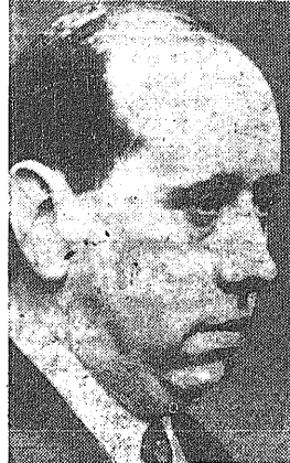
EL DEMAGOGO NEGRO

Titulése la conferencia "La crisis española y las instituciones republicanas". Luego de examinar la obra de A.R.E. y de la Junta Española de Liberación como antecedentes de las instituciones republicanas, dijo así el señor Albornoz: cuerpo legal, que habían quedado inéditos. De dicho documento, debido en buena parte, no ya a la inspiración, sino a la colaboración directa de un socialista ilustre, quiero evocar algunos párrafos. Uno es el siguiente: "Nosotros, tal vez por el entrecruzamiento durante siglos con los pueblos del Oriente, tenemos el deseo hondo de evitar la oposición Oeste Este (que es en nosotros, con frecuencia, psicológicamente hablando, la larva de un profundo dualismo). Aspiramos a superar la oposición entre el Oeste y Rusia, adalid del Este europeo. En la búsqueda de la concordia, a base de mutuo respeto en la respectiva visión de la vida individual e histórica, pondrá el Gobierno de la República sus mejores afa-