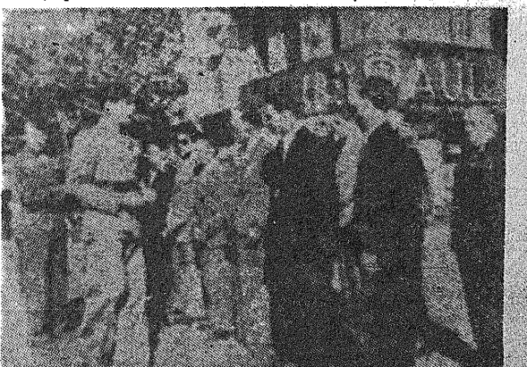
Combatientes españoles condecorados en una ceremonia celebrada en Pau el pasado año.

Escuchándole en silencio es como querremos rendir nuestro homenaje al Libertador de París y a la División que llevó su nombre. Escuchándole en silencio para cumplirlo y gritando recio para que nos oiga el mundo: Por encima de los muertos, adelantel París, Diciembre de 1947