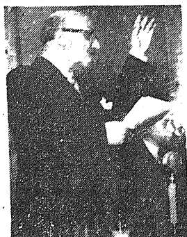
El gran poeta León Felipe, que acaba de publicar "Aniología Rota", éxito de público y de crítica