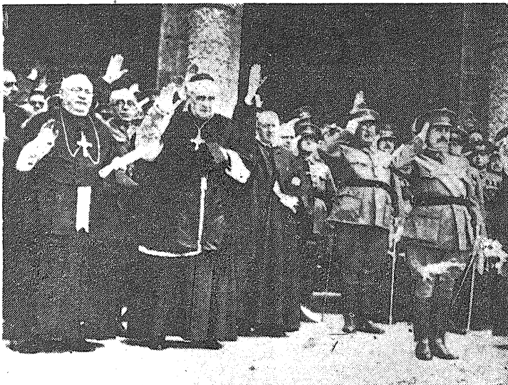
"Hay que escoger, en electo, entre el franquismo y la democracia. Porque entre esas dos concepciones no hay término medio. Hay que escoger entre Cristo y el asesino, ya que es tiempo, ya es más que tiempo de que las jerarquías católicas denuncien en público, definitivamente, ese horrible contubernio". (ALBERT CAMUS).

Excmo. Sr. Ministro: Recibí sus cartas del 10 y del 15 del mes último de octubre, a las cuales adjuntaba un informe sobre el escrito dirigido a V. E. como delegado Nacional de Sindicatos por la Hermandad Obrera Católica, Hermandad Obrera Católica, Hermandad Obrera Católica femenina, Juventud Obrera Católica y Juventud Católica Obrera Femenina con sus anexos correspondientes.