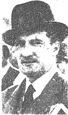
ra su personalidad y se reintegrara en el goce de legítimos derechos, desconocidos por la monarquía y suprimidos por la tiranía.

Se había convenido, en efecto, que el problema vasco, el que principalmente le incumbía, no podía tener solución adecuada y completa con actitudes y tácticas erradamente intrínsecas, inspiradas en el temor, el no entendimiento y el odio, sino mediante procedimientos políticos más abiertos y con más flexibilidad y adaptación a las circunstancias, con espíritu de cooperación y solidaridad; en una palabra, cuando la solución en el marco de la patria, no era posible, era a través de relaciones, gráficas, de un poder central autoritario y dominante, sino colaborando con los demás pueblos peninsulares para transformar el fondo, la estructura, con el fin de conjugar y lograr que cada uno de esos pueblos resista