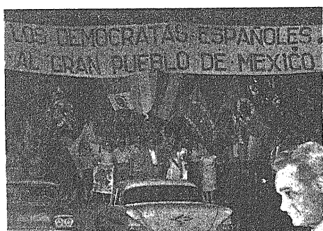
La manifestación de los republicanos españoles frente al Plaza Hotel de Buenos Aires.

Tras una serie de actos protocolares en el Plaza Hotel, el ilustre viajero, a las 18 se dirigió en automóvil descubierta a la Casa Rosada, donde iba a ser oficialmente recibido por el presidente de la República Argentina y su gobierno. Si calurosísima había sido la extinción de sentimientos populares en la Plaza de San Martín, más se capeó la que se puso de relieve a lo largo del trayecto que, por Florida, la Diagonal y la Plaza de Mayo, recorrió el viajero antes de llegar a la Casa de Gobierno. Rotas las barreras policíacas,