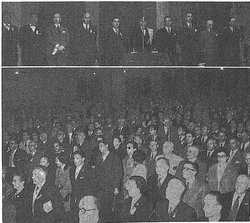
ARRIBA: Algunos de los oradores del magnífico acto organizado por "Amigos de la República" y personas. ABAJO: Aspecto de un sector del teatro al entonarse los himnos patrios