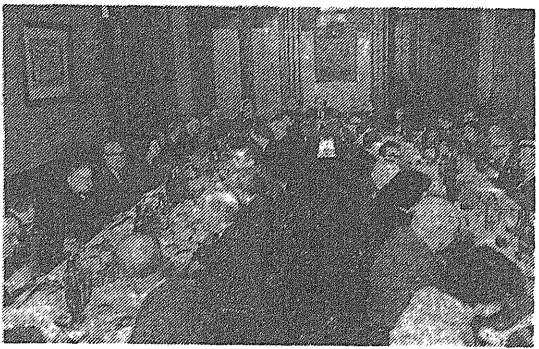
Un aspecto de la mesa presidencial

Para ofrecer la demostración, uso de la palabra el doctor Claudio Sánchez Albornoz, quien con afectuosos términos, saludó la presencia en el Centro Republicano Español, por vez primera, del nuevo embajador de Méjico, amigo nuestro como lo son todos los mejicanos. Nos sentimos los exiliados —agregó— ciudadanos del mundo, pero tenemos, además, una patria elegida por el corazón: Méjico, que jamás desertó de su lealtad a la República Española. Siempre hemos estado orgullosos de Méjico y no habrá, en el día de nuestro retorno, una ciudad española en que una calle no proclame, con su nombre, el amor al pueblo azteca.