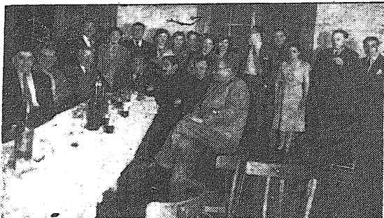
Los correligionarios de Río Gallegos en la comida del 14 de Abril

(Viene de la pág. 2) colonias de republicanos españoles, acompañadas de los amigos chilenos, celebraron en los diversos centros sociales de Valparaíso, San Antonio, Antofagasta, Concepción y Osorno, los días 12 y 19 de abril, diversos actos conmemorativos de la proclamación de la República Española. En todos ellos reinó el mayor entusiasmo entre todos los asistentes.