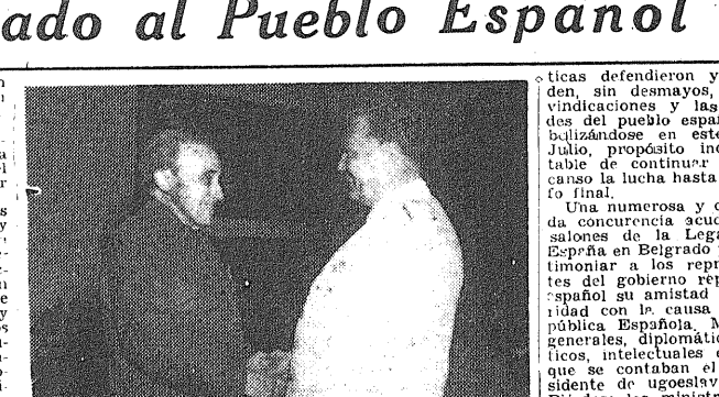
El mariscal Tito estrecha la mano del jefe del gobierno de la República Española, don Félix Gordón Ordás.

Por la noche la Asociación de Antiguos Combatientes ofreció una cena a los señores Gordón Ordás y Arauz en el Club de Ministros. Numerosos ex combatientes yugoslavos en el ejército republicano español, hoy dirigentes de la política y altos mandos en el ejército de Yugoslavia, estuvieron presentes en la fiesta, en la que se recordaron episodios de la lucha del pueblo español contra el fascismo nacional e internacional. Al finalizar el banquete, el presidente del Consejo, D. Félix Gordón Ordás, hizo una amplia información de la situación actual del problema español y los diversos aspectos y posibilidades de la lucha por la liberación de España y la restauración de su régimen legítimo. Gordón Ordás visitó el día 18 la Facultad de Veterinaria de Belgrado, siendo acompañado por el director, profesores y alumnos. El doctor Arauz conferen-