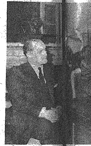
El señor Gordón Ordiá, Aguirre, presidente del gobierno, y ministro de Hacienda.

Analizó lo que él llama peso muerto en los presupuestos, integrado por lo anterior y los gastos enormes de las fuerzas armadas, todas ellas represivas contra el propio pueblo español, y que suman en el presupuesto de 1951 cerca del 75 quedando un 25 por 100, solamente para las demás atenciones y necesidades, con lo que están por insuficientemente dotadas han dado lugar a la decadencia y situación anárquica de la industria, agricultura, finanzas, transportes, clases, viviendas, educación, etc. Los presupuestos franquistas para 1951, a juzgar por las cifras que se publican en algunos periódicos, en todo el mundo, superan las cifras de este desastroso presupuesto francés en todo el mundo, en 1951, en un déficit de 293 millones, cifra que no puede ser cubierta por el Estado.