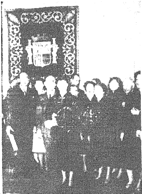
La ilustre actriz María Casares, en la residencia del Gobierno de la República Española, en París, al final del brillante acto en que le fue impuesta la Orden de la Liberación

Las revelaciones, perfectamente imparciales, hechas por "Echo der Woche" muestran que el fascismo levanta la cabeza, que en determinados lugares ha pasado ya a la acción, que debe poseer un plan de conjunto y que su primer objetivo parece ser la conquista de fuertes posiciones en la cuenca mediterránea. Se puede indicar además que los hombres más influyentes del movimiento se encuentran en España, y que es en Egipto donde la organización de los cuadros y de los efectivos se halla más avanzada".