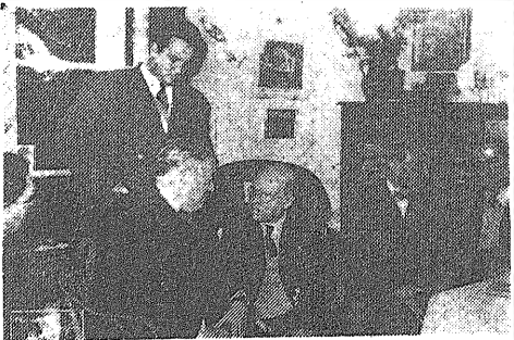
Después de la imposición de la placa y botón de maestrante de la Orden de la Liberación, el maestro Pablo Casals conversa con el presidente de la República, don Diego Martínez Barrio; el jefe del Gobierno, señor Gordón Ordás, y el ex presidente del Consejo don Rodolfo Llopis.

PARIS. — El día 30 de diciembre último, con ocasión de cumplir el maestro Casals 75 años de edad, tuvo lugar en Prades el acto realmente emocionante de serle impuestas las insignias de la Orden de la Liberación de España. Desde voluntariamente desde hace trece años en aquella villa de la Lana de los Pirineos catalanes, como profeta de la era del régimen opresor que lleva nuestra patria, y la indicante conductora de las grandes democracias, el ilustre artista que ha inmortalizado su arte a su civismo ejemplar, querido recibir este honor merecidamente otorgado por el Gobierno de la República en el exilio en la modesta residencia que ocupa en el pueblo, que ya ha visto pasar a gran número de los mejores artistas del mundo en visita al maestro, y que en el día recibió al señor presidente de la República Española, al jefe del Gobierno y personalidades delegadas por el Gobierno de París y de las ciudades de Francia.