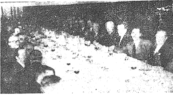
Un aspecto de la brillante fiesta