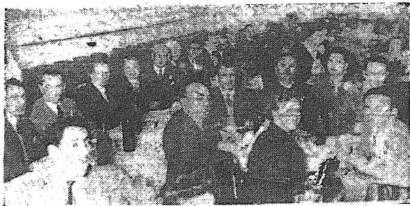
Aspecto de la presidencia del banquete de camaradería

Quiera o no quiera el Santo Padre, el San Fermín es todo eso, con sus buenos y muy alegres ribetes paganos. Así lo conocimos antaño, cuando una monarquía por la gracia de Dios y una dictadura bendita por el nuncio apostólico hubieran podido salvaguardar, en todo caso, las esencias más caras de la conmemoración. El San Fermín evocaba corridas de feria y jurga a todo pasto, gorgoros de aupa y bureo de tres días sin pegar ojo. Y tras ese bendito San Fermín se vocaban en Pamplona es, paños de todas las regiones y extranjeros de todos los países, ansiosos de gozar una jornada sin par en que toda Pamplona era una inmensa catedral de alegría y hospitalidad. A la sombra de un santo que había hecho el feliz milagro de convertir en música, vino y canción los humores atormentados de su sacrificio. Aquí, en Buenos Aires, la Agrupación Navarra Republicana resucita por esos días de tradición. En un momento de la capital argentina, centenares de navarros fieles al recuerdo de su tierra y de las fiestas de Pamplona, hacen la fecha con todo el color y la animación de la tierra lejana. Sin imprevista lo que es momento para que la evocación sea fiel y así se impugna por ejemplo una fiesta de toros. Lo que no es imposible imprimir es el espíritu, que surge arrollador y vibrante, con sus características más valientes. Desde el punto de la memoria, en una calle que se llama Charabuc, un hombre, ciento por