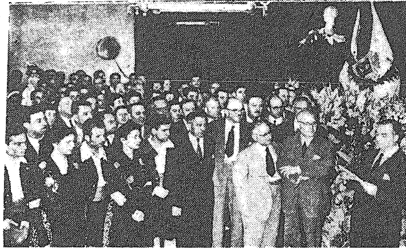
Un aspecto de la velada necológica