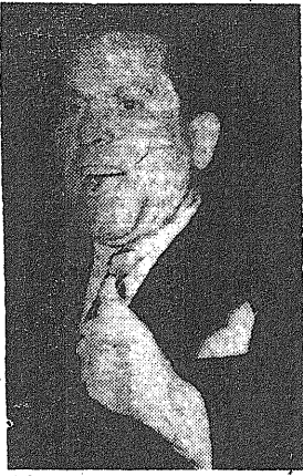
Ultima fotografía de El Campesino, durante su comparecencia en el proceso promovido en París contra el semanario comunista "Lettres Françaises". El Campesino exclama con energía y convencimiento: "El comunismo es el fascismo con bandera roja".

De ahí deduce que el régimen de Stalin es el prototipo acabado del totalitarismo. Es el régimen totalitario que jamás haya existido —sostiene— Exige que se crea en la superioridad del soviétismo y en