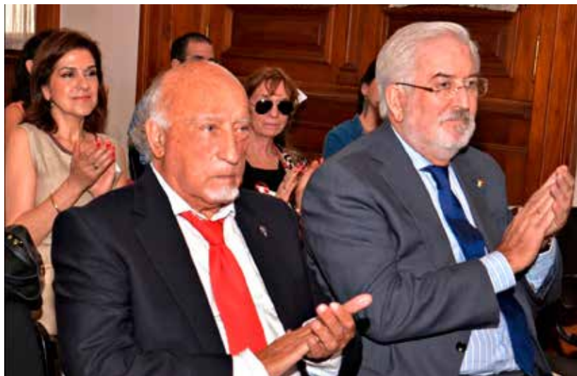
Manuel Vicent y el Embajador de España en Argentina, don Estanislao de Grandes Pascual